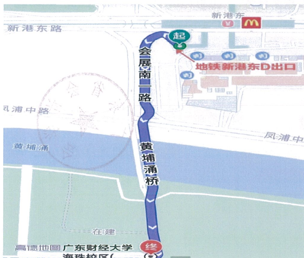
图 1. 由新港东路地铁站到达广东财经大学广州校区（东北门）交通示意图